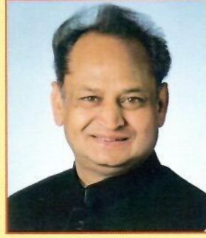
श्री अशोक गहलोत